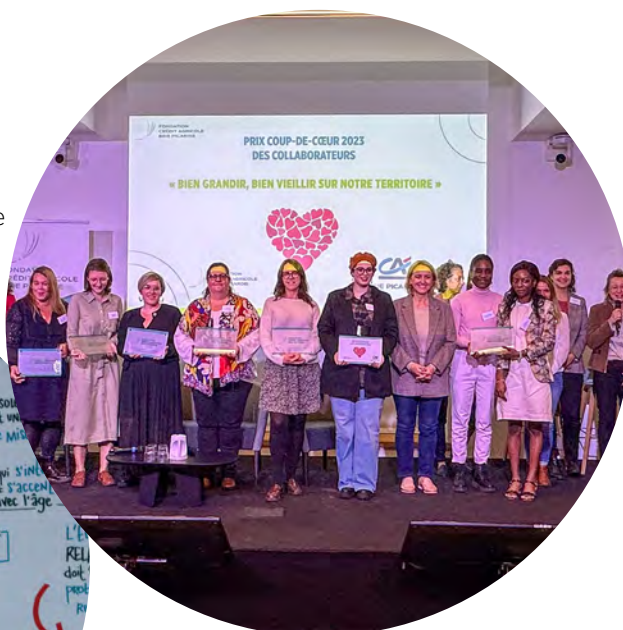
Remise des prix de la Fondation Crédit Agricole Brie Picardie

• 393 projets locaux soutenus dont 235 en 2024 et récompensés en 2025.