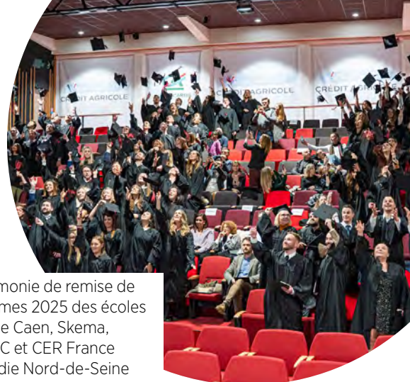
Cérémonie de remise de diplômes 2025 des écoles IUP de Caen, Skema, ESSEC et CER France Picardie Nord-de-Seine