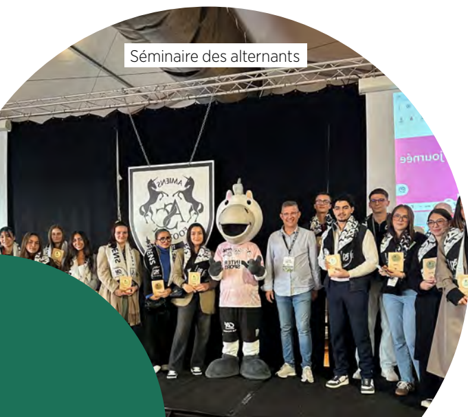
Séminaire des alternants