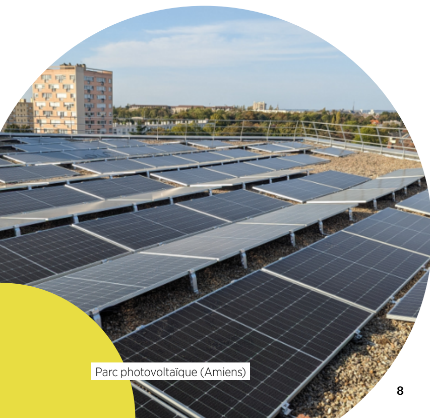
Parc photovoltaïque (Amiens)